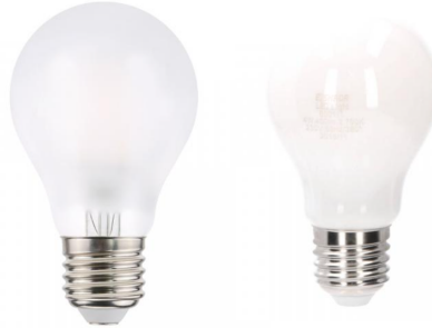
Foto van het product

Shada B.V. Kanaal Noord 350 7232 AM Apeldoorn